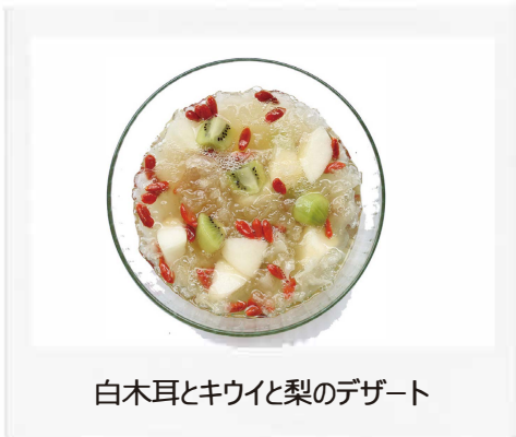
白木耳とキウイと梨のデザート