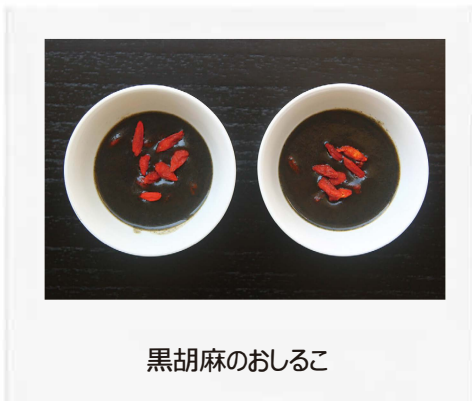
黒胡麻のおしるこ