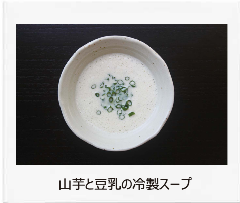
山芋と豆乳の冷製スープ

これらは一例です。ご家庭で作る時は「補陰、生津」などの食材を上手に組み合わせれば「家庭の薬膳」になります。ほてりが強い時は寒涼性や清熱の食材を使うと良いでしょう。